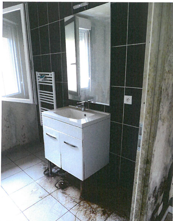
Photos n° 15 – 16 : PARTIES INTERIEURES ; SALLE DE BAINS SITUEE A COTE