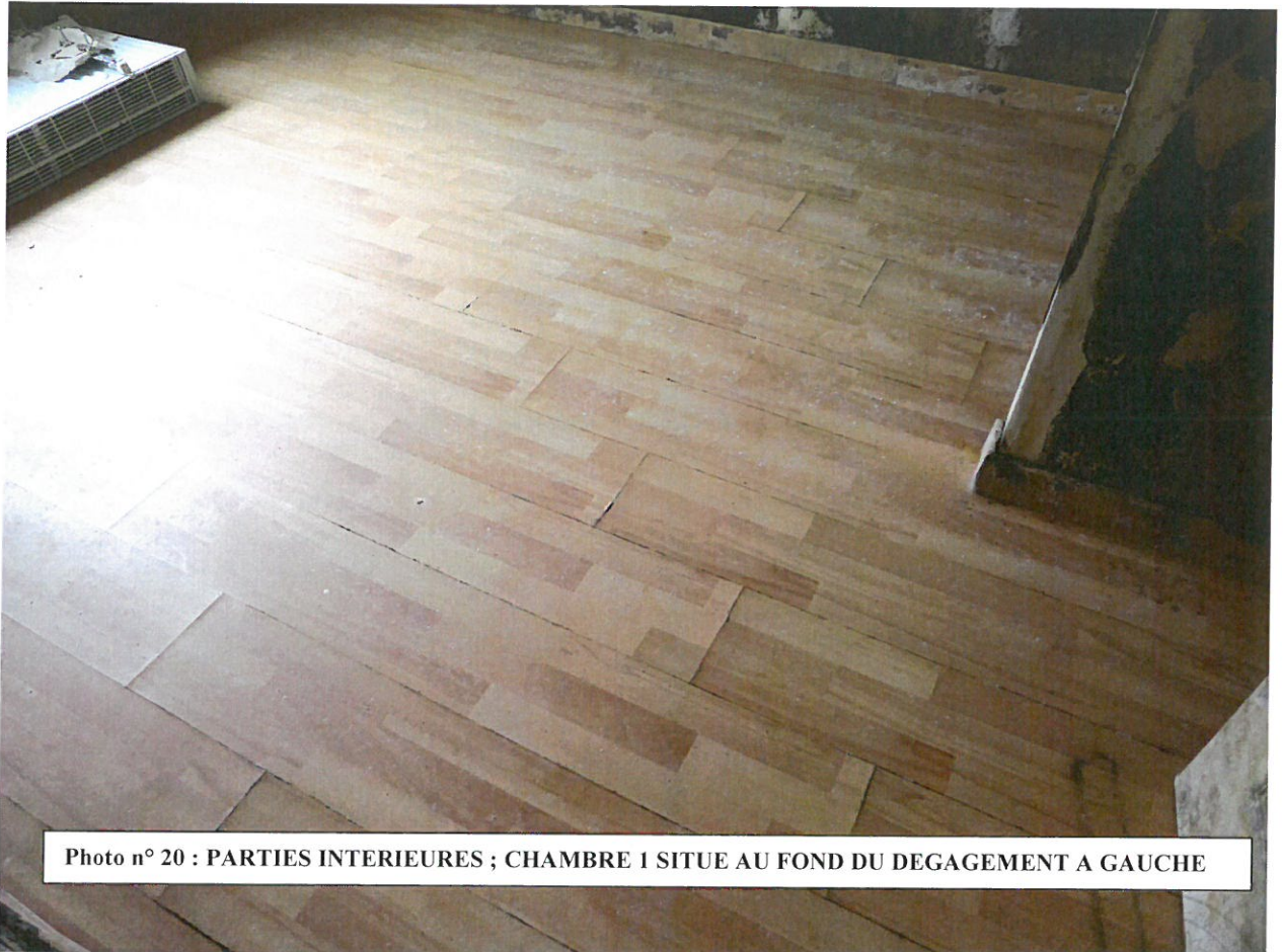
Photo n° 20 : PARTIES INTERIEURES ; CHAMBRE 1 SITUE AU FOND DU DEGAGEMENT A GAUCHE