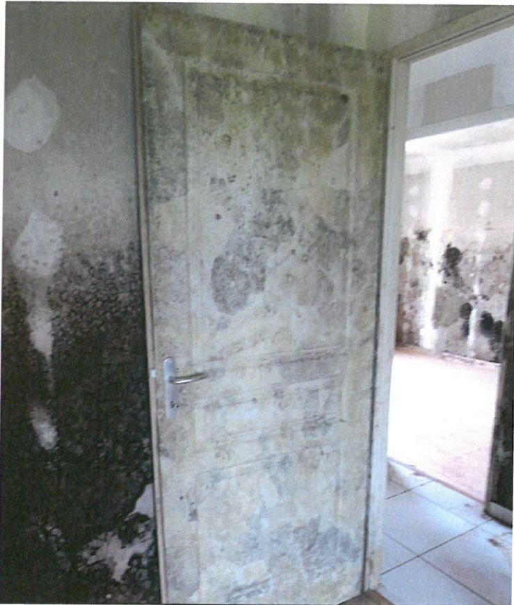
Photo n° 25 : PARTIES INTERIEURES ; CHAMBRES 2 & 3 SE TROUVANT COTE DROIT AU FOND DU DEGAGEMENT