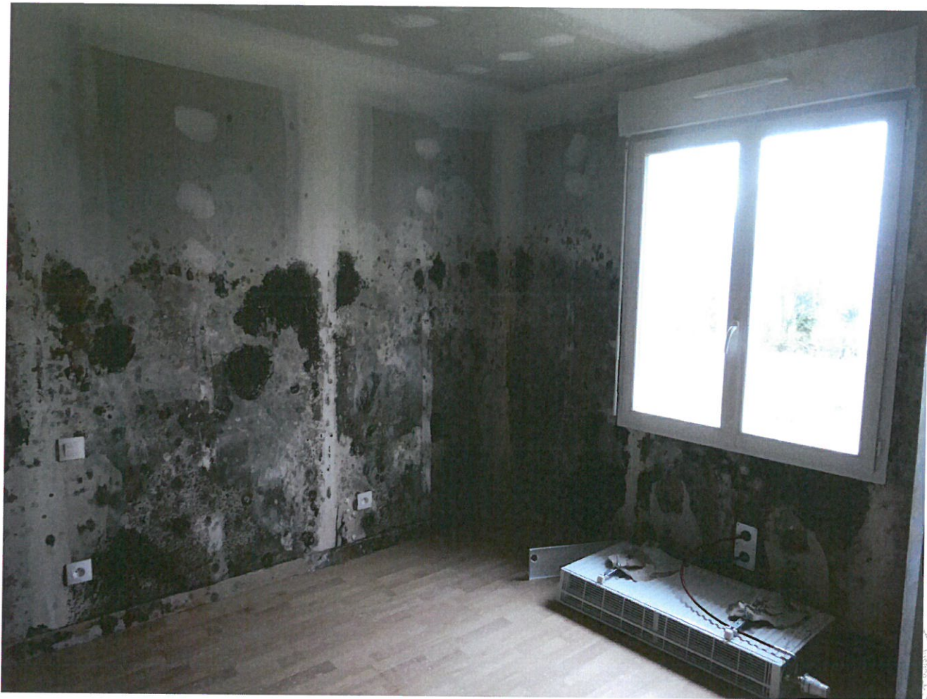
Photos n° 21 – 22 : PARTIES INTERIEURES ; CHAMBRES 2 & 3 SE TROUVANT COTE DROIT AU FOND DU DEGAGEMENT