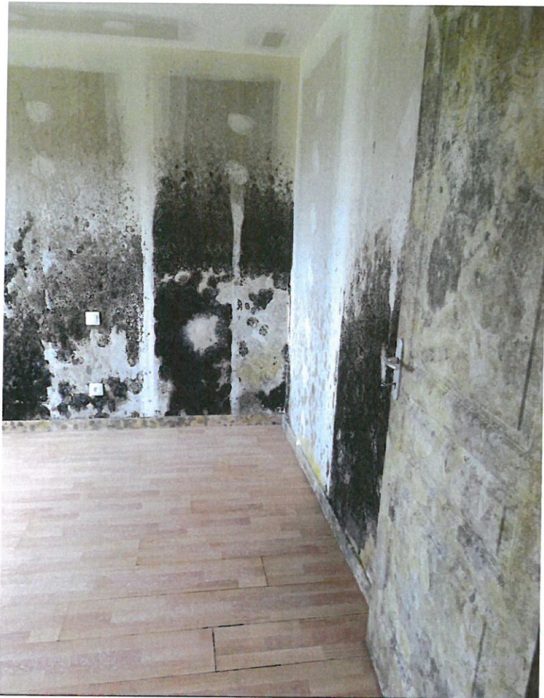
Photos n° 23 – 24 : PARTIES INTERIEURES ; CHAMBRES 2 & 3 SE TROUVANT COTE DROIT AU FOND DU DEGAGEMENT