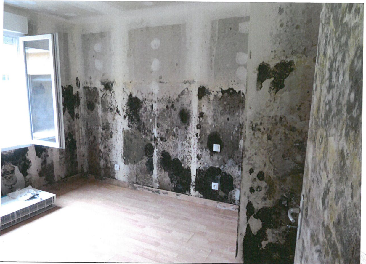
Photos n° 18 – 19 : PARTIES INTERIEURES ; CHAMBRE I SITUE AU FOND DU DEGAGEMENT A GAUCHE