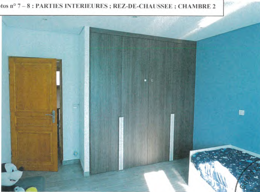
Photos n° 7 – 8 : PARTIES INTERIEURES ; REZ-DE-CHAUSSEE ; CHAMBRE 2

Equipements électriques de la pièce : Un interrupteur électrique simple, quatre prises électriques. (Voir photos n° 7 – 8).