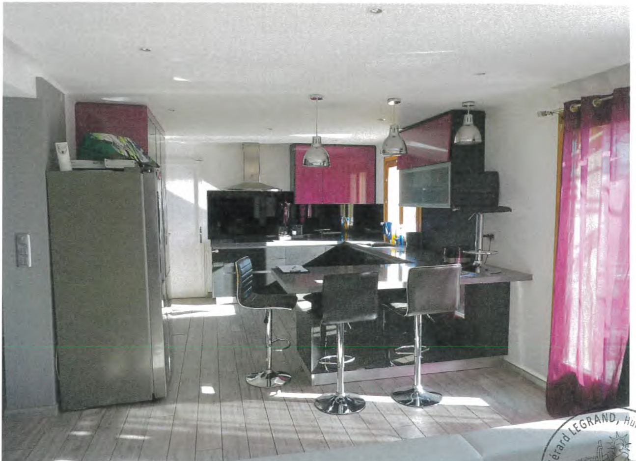
Photos n° 20 – 21 : PARTIES INTERIEURES : REZ-DE-JARDIN ; SEJOUR/CUISINE