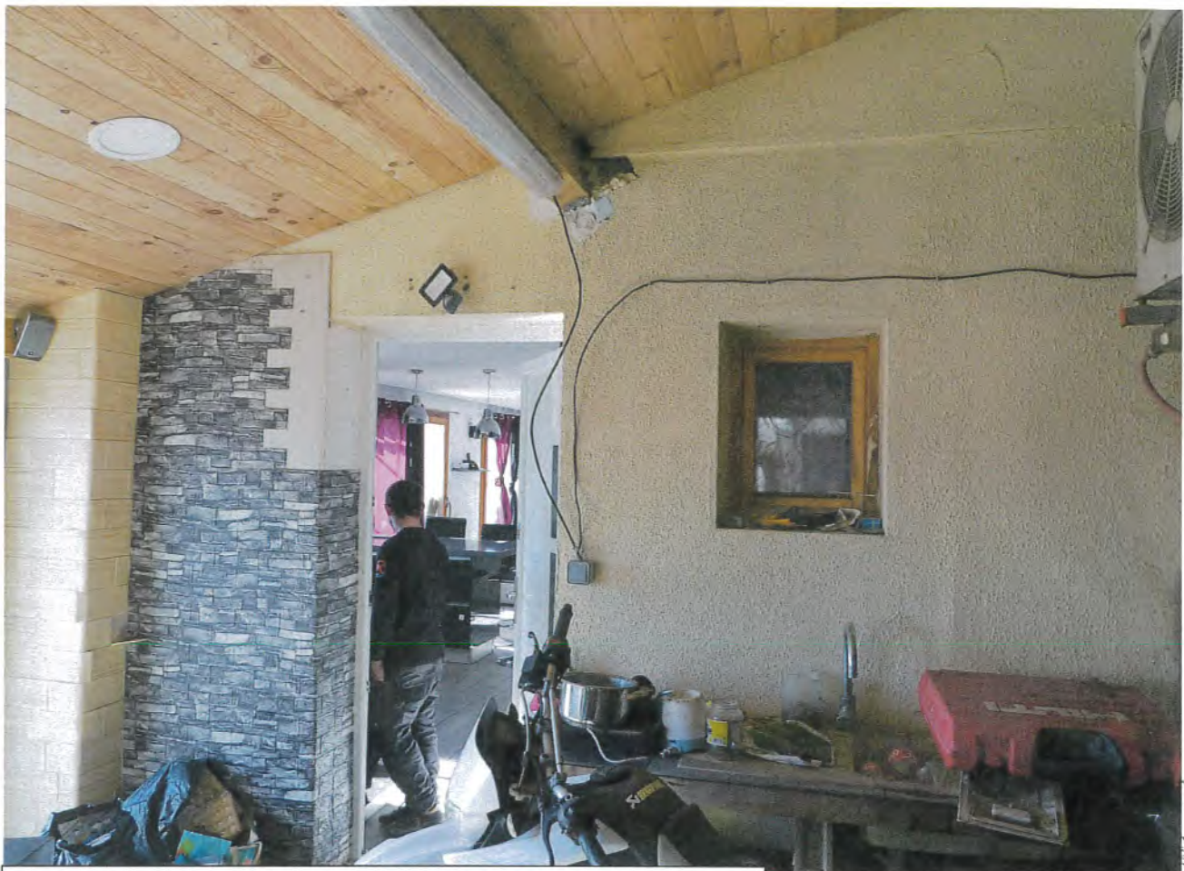
Photos n° 24 – 25 : PARTIES INTERIEURES ; REZ-DE-JARDIN ; CUISINE D'ETE