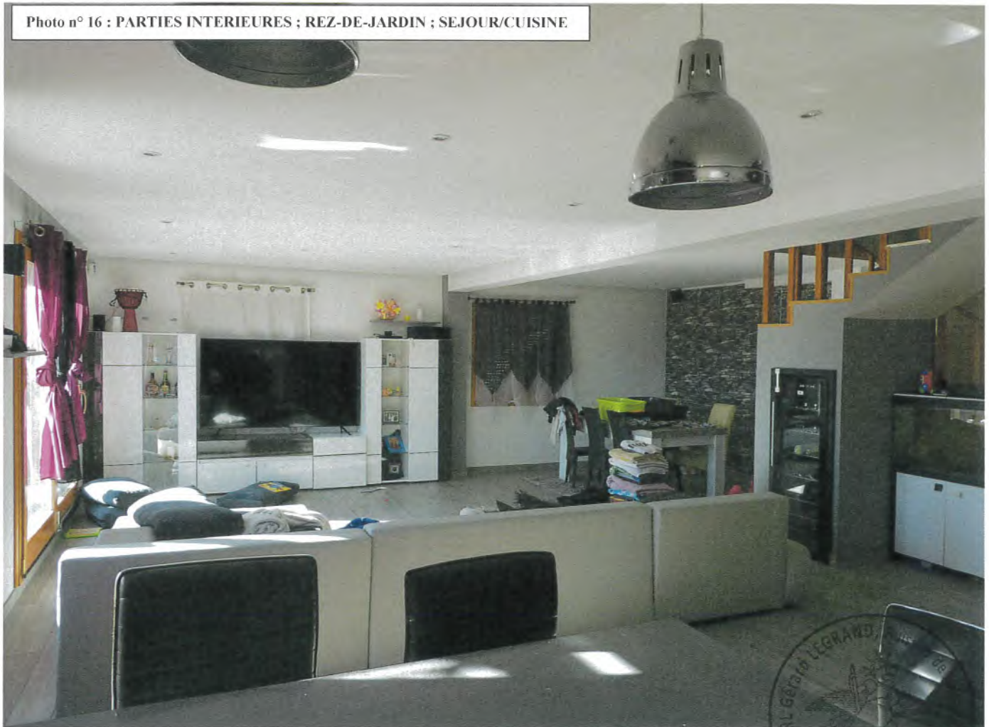
Photo n° 16 : PARTIES INTERIEURES ; REZ-DE-JARDIN ; SEJOUR/COUISINE

Equipements électriques de la pièce : Spots intégrés au plafond, quatre interrupteurs électriques doubles, un interrupteur électrique simple, dix-huit prises électriques, une prise tv. (Voir photos n° 16 jusqu'à 21).