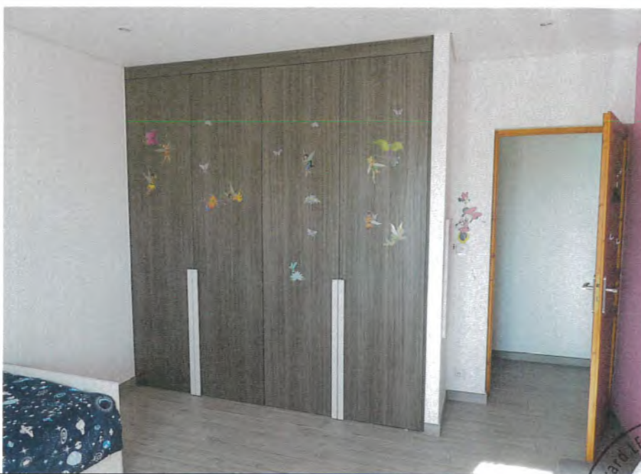
Photos n° 9 – 10 : PARTIES INTERIEURES ; REZ-DE-CHAUSSEE ; CHAMBRE 3

Equipements électriques de la pièce : Deux interrupteurs électriques simples, quatre prises électriques. (Voir photos n° 9 – 10).