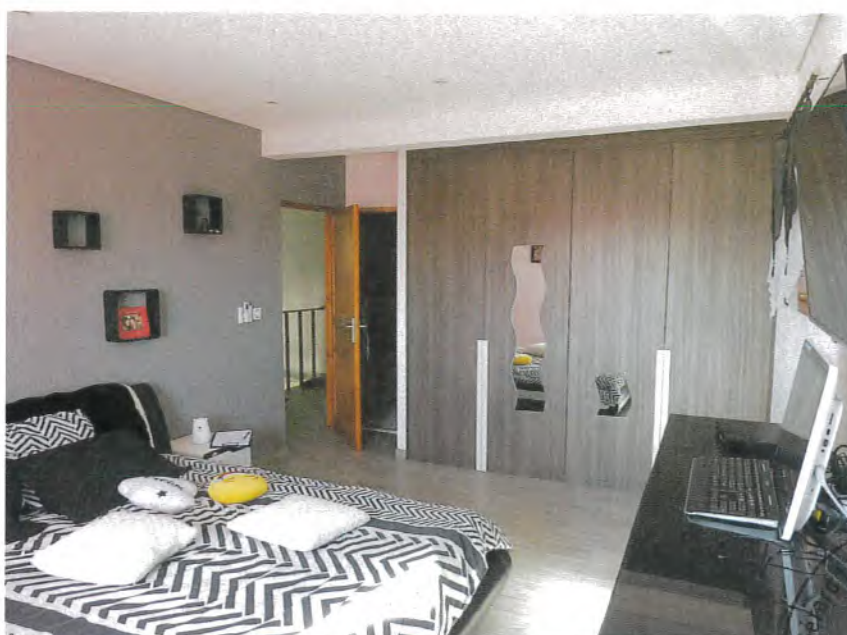
Photos n° 5 – 6 : PARTIES INTERIEURES ; REZ-DE-CHAUSSEE ; CHAMBRE 1

Equipements électriques de la pièce : Un interrupteur électrique simple, cinq prises électriques. (Voir photos n° 5 – 6).