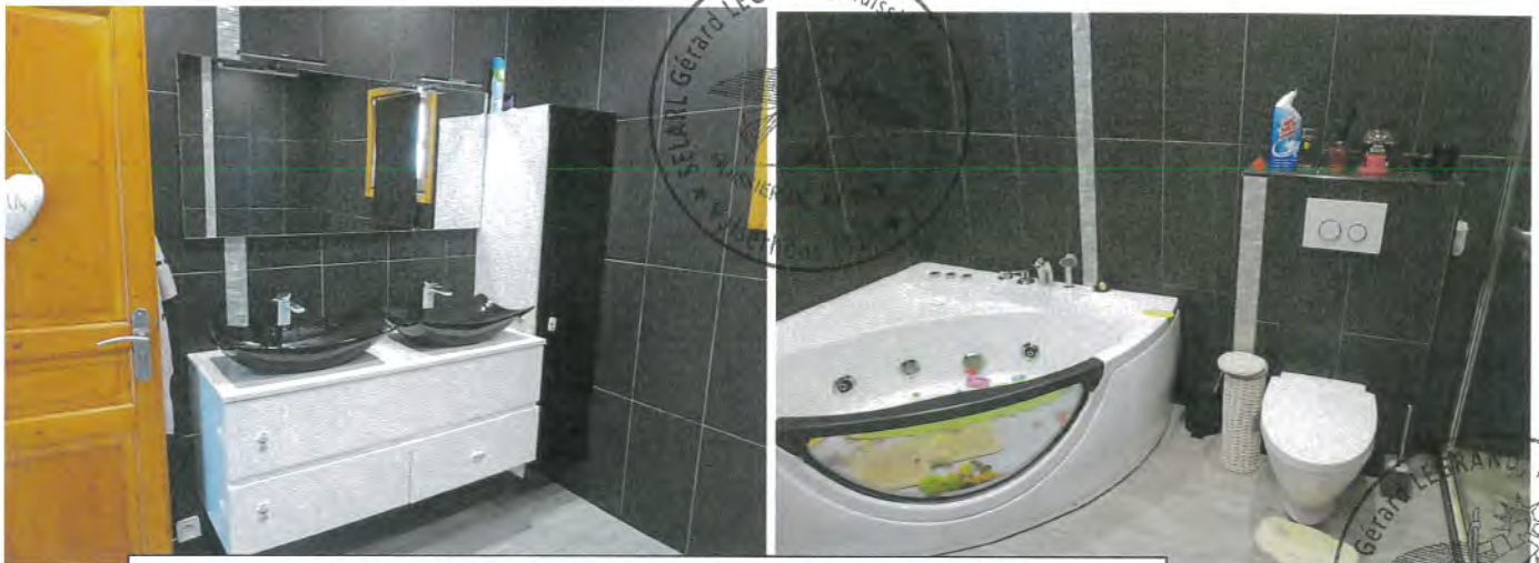
Photos n° 11 – 12 – 13 : PARTIES INTERIEURES ; REZ-DE-CHAUSSEE ; SALLE DE BAINS

Equipements électriques de la pièce : Un interrupteur électrique double, deux prises électriques, spots intégrés au plafond, un radiateur sèche-serviettes mural. (Voir photos n° 11 – 12 – 13).