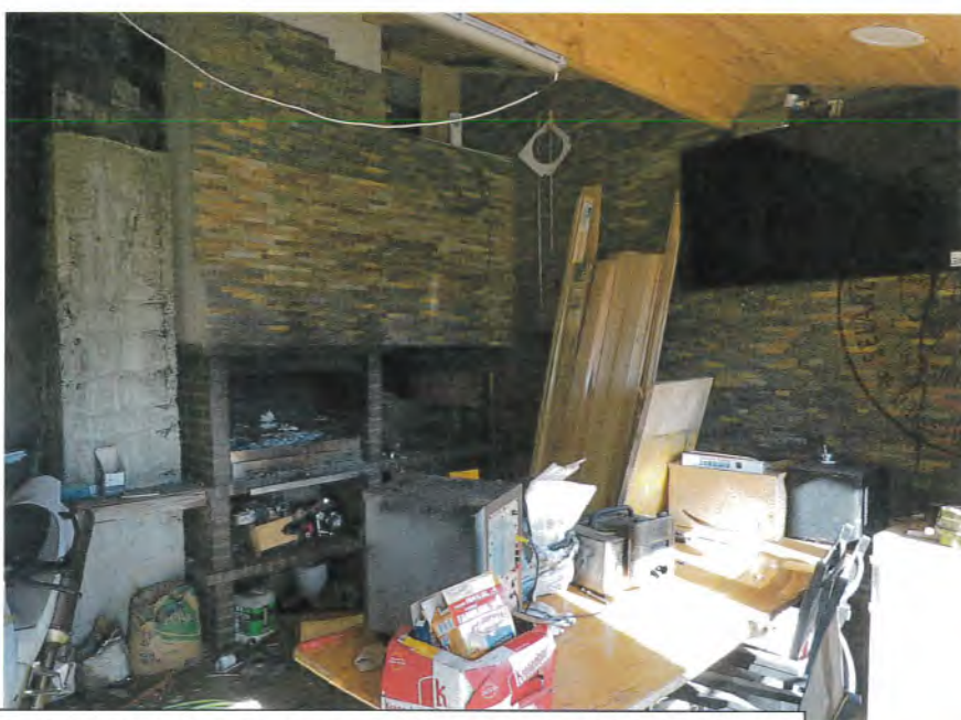
Photos n° 22 – 23 : PARTIES INTERIEURES ; REZ-DE-JARDIN ; CUISINE D'ETE

La pompe à chaleur est fixée sur le mur à gauche en entrant. (Voir photos n° 22 jusqu'à 25).