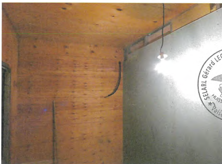
Photos n° 14 – 15 : PARTIES INTERIEURES ; REZ-DE-CHAUSSEE ; GARAGE AMENAGE ; CHAUFFAGE AU REZ-DE-CHAUSSEE

L'ensemble du rez-de-chaussée est chauffé par un plancher chauffant pompe à chaleur. (Voir photos n° 14 – 15).