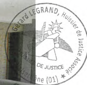
Photos n° 17 – 18 – 19 : PARTIES INTERIEURES ; REZ-DE-JARDIN ; SEJOUR/CUISINE